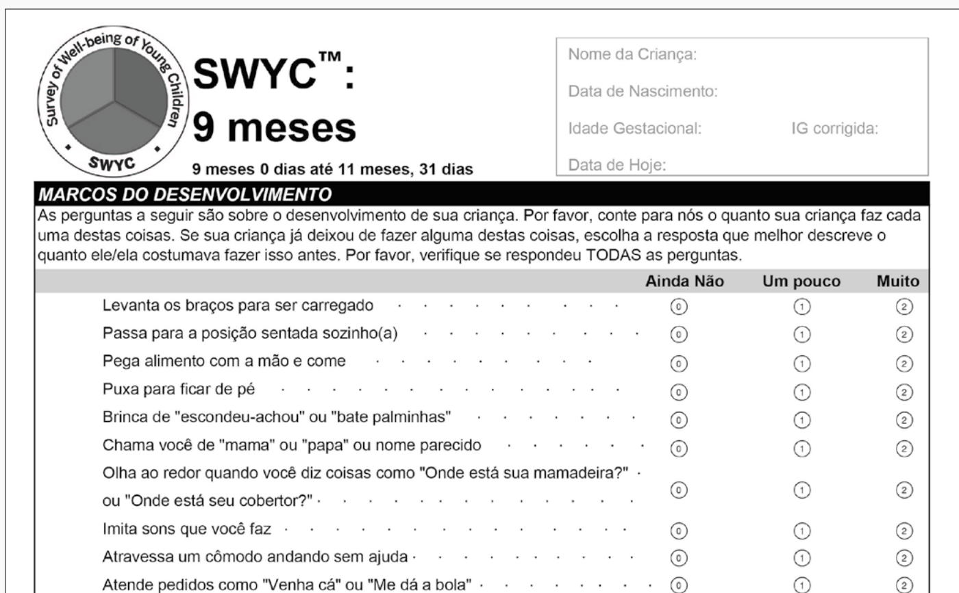
Figura 2 – Exemplo de Questionário MD-SWYC-BR